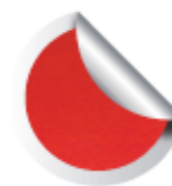
Cod. 950 Botero