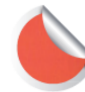
Cod. 909 Matisse