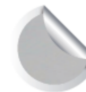
Cod. 911 Michelangelo