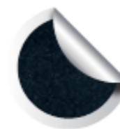
Cod. 914 Caravaggio