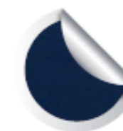
Cod. 904 Kostabl