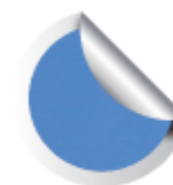
Cod. 902 Glotto