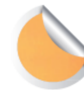
Cod. 908 Van Gogh