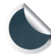
Cod. 922 Dali