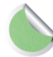
Cod. 919 Botticelli