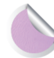
Cod. 910 Raffaello