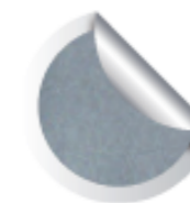
Cod. 915 Leonardo