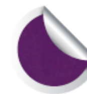
Cod. 924 Mirò