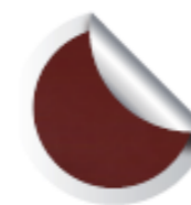
Cod. 923 Modigliani